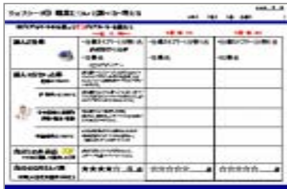
記入用シートサンプル

1年間の職業研修の導入部分。WEBサイトを活用した職業検索を実施。放課後や自宅学習などでも活用。